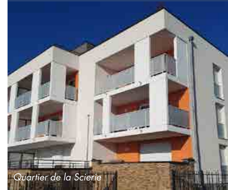
Quartier de la Scierie

Malgré cela, nos jeunes peinent à trouver à se loger sur Brumath tant la demande est forte. Il y a actuellement 140 demandes de logement non satisfaites et le délai moyen d'attente d'un logement aidé est de 11 mois.